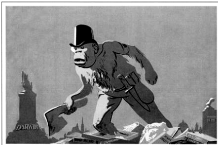
КАПИТАЛИЗМ – ВРАГ КУЛЬТУРЫ.

П. С. Как нам стало известно, газета «Петроград» вошла в пятерку самых читаемых анархических изданий страны. Многие распечатывают её из интернета и распространяют в своих городах, чему мы, конечно же, очень рады. Так держат! Количество тем от номера к номеру постоянно растёт, появляются новые рубрики, так что прогресс налицо. Так что, принося извинения за небольшую задержку с выходом этого номера, мы обещаем нашим читателям появление новых интересных и оригинальных материалов в будущем.